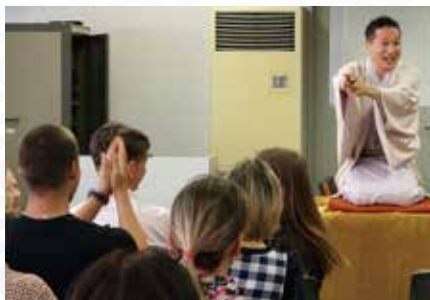
絶妙なりアクションのロシア人男性